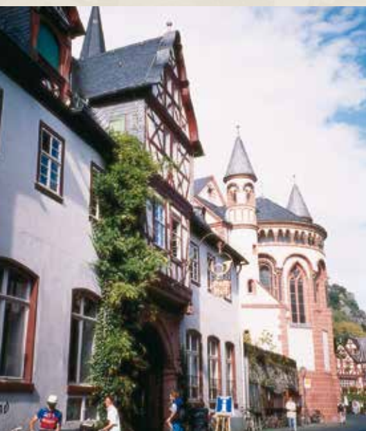
Posthof und Peterskirche

Die Peterskirche , evangelische Pfarrkirche, befindet sich in der Mitte der Stadt. Der Bau wurde schon um 1100 begonnen und im 14. Jahrhundert mit dem Turm beendet (romanisch-gotischer Übergangsstil). Gegenüber dem verhältnismäßig niedrig gehaltenen Chor, der unter einem früheren Baumeister errichtet worden ist, strebt das Langschiff in gewaltiger Höhe empor. Eine reiche Aufgliederung, zwei Seiten und eine Orgelempore, romanische Triforien, ein Querschiff, das über die seitlich angebauten Kleinschiffe hinreicht, Freskoge-mälde aus dem Mittelalter, auf merkwürdigen Sockelgebilden errichtete Halbsäulen, tropfen-artig herabhängende Bogenabschlussstücke, eine Anzahl interessanter Grabdenkmäler